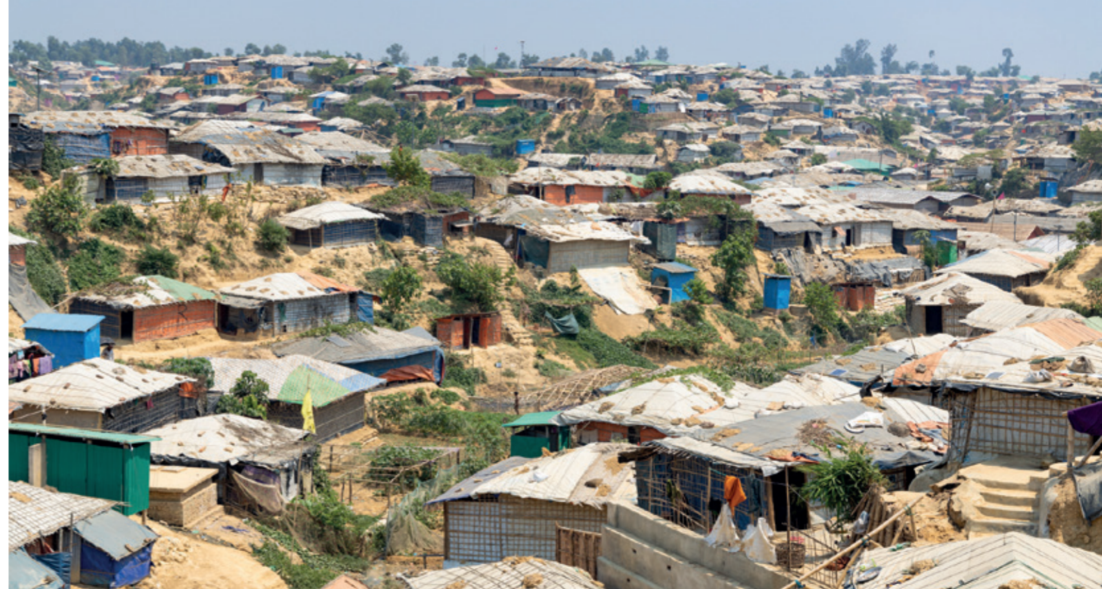
Flyktinglägret Kutupalong är hem för över 600 000 människor. Lägret har rests på ett område där djungeln röjts bort. Kraftiga regn och cykloner, som monsunperioden hämtar med sig, samt eldsvådor, hotar flyktingarnas enkla boningar.

Det är ett litet mirakel att man lyckades undvika stora sjukdomsepidemier.