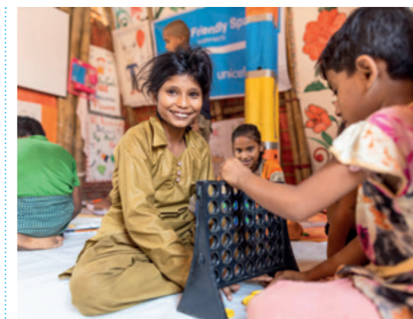
Barnen leker på en UNICEF-understödd barnvänlig plats i flyktinglägret Kutupalong.