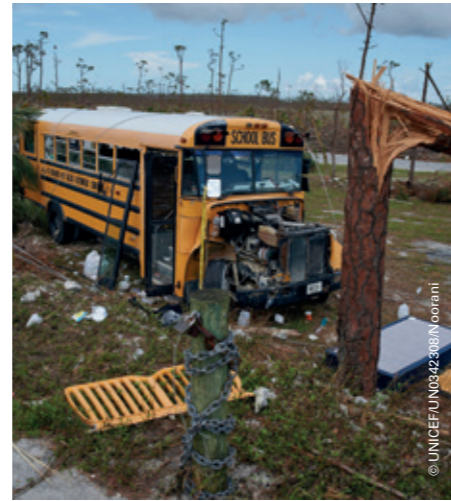
Klimatförändringen ökar antalet extrema väderfenomen och deras destruktiva kraft. På bilden syns en skolbuss som förstördes av orkanen Dorian på Bahamaöarna i september.

Dessutom gör vi påverkansarbete för att staterna och företagen ska ta i beaktande hur klimatförändringen påverkar barnen och låta barnen få vara med och påverka i klimatärenden.