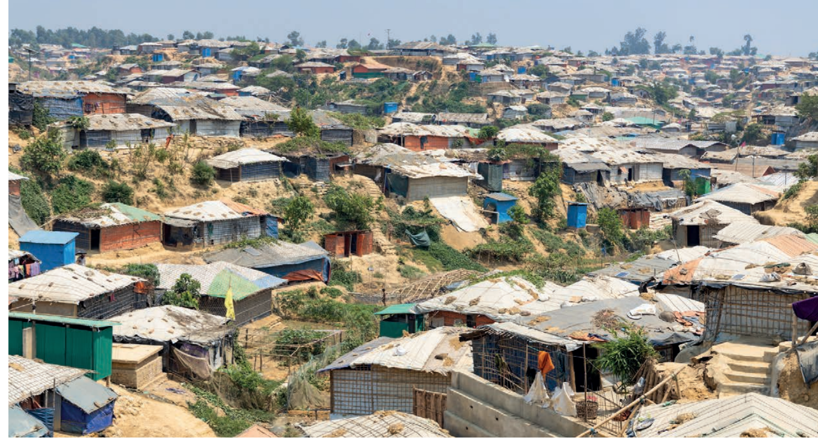
Kutupalongin pakolaisleiri on yli 600 000 ihmisen koti. Leiri on noussut viidakosta raivatulle alueelle. Monsuunikauden mukanaan tuomat rankkasateet ja syklonit sekä toisaalta tulipalot uhkaavat pakolaisten kevyitä asumuksia.

Tällä hetkellä kaikki peruspalvelut toimivat, ja alun