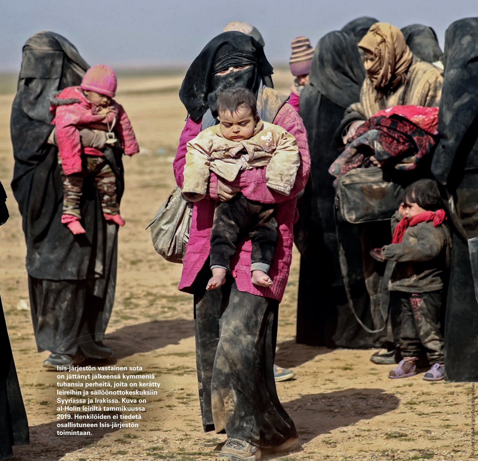
Isis-järjestön vastainen sota on jättänyt jälkeensä kymmeniä tuhansia perheitä, joita on kerätty leireihin ja säilöönottokeskuksiin Syyriassa ja Irakissa. Kuva on al-Holin leiriltä tammikuussa 2019. Henkilöiden ei tiedetä osallistuneen Isis-järjestön toimintaan.