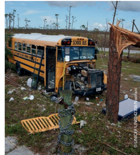
Ilmastomuutos lisää äärimmäisten sääilmiöiden määrää ja tuhovoimaa. Kuvassa hurrikaani Dorianin tuhoama koulubussi Bahama-saarilla syyskuussa.

Lisäksi teemme vaikuttamistyötä, jotta valtiot ja yritykset huomioisivat ilmastomuutoksen vaikutukset lapsiin ja lapset pääsisivät vaikuttamaan ilmastoasioissa.